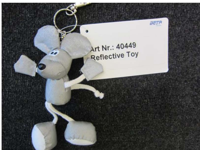
Article no. 40449