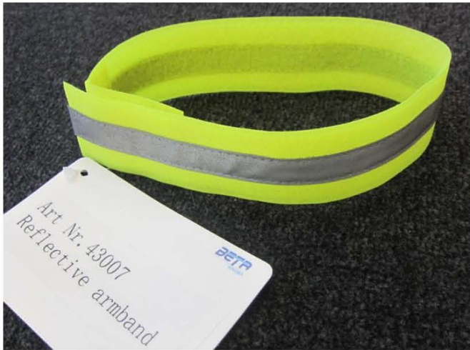
Article no. 43007