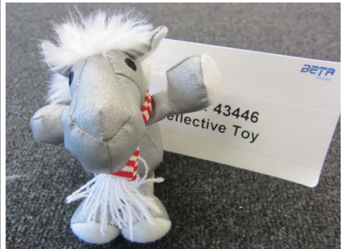
Article no. 43446