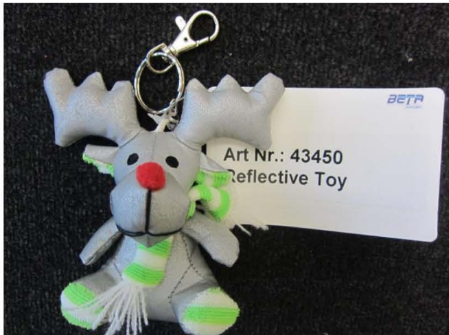
Article no. 43450