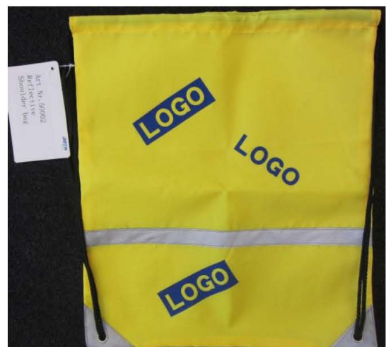
Article no. 50002