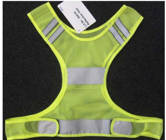
Article no. 50019