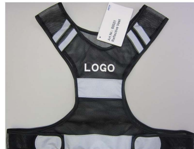
Article no. 50021